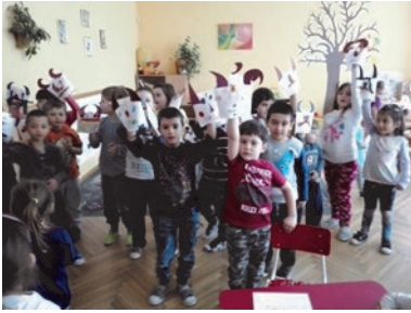
Sághy Krisztina írása

A Farsang a vízkereszttől hamvazószerdáig tartó hosszú, vidám, télbúcsúztató időszak. Az óvodában igen mozgalmas hetek ezek. Belevetettük hát magunkat a farsangi előkészületekbe. Elsőként az évszakok, hónapok, napok neveinek gyakorlása közben próbáltuk tudatosítani, hogy a „farsang” nem egy napot, hanem egy időszakot jelent, amely pontosan Vízkereszt után kezdődik. Megismerkedhettek a gyerekek régi falusi szokásokkal, néphagyományokkal, kiemelve, ami öhozzájuk legközelebb áll: a farsangi alakoskodást, a zenés-táncos mulatozást. Ennek megfelelően több napot is énekléssel, zenével, táncsal töltöttünk, amiben külön öröm volt, hogy többször kérték az újdonságként bemutatott népzene meghallgatását.