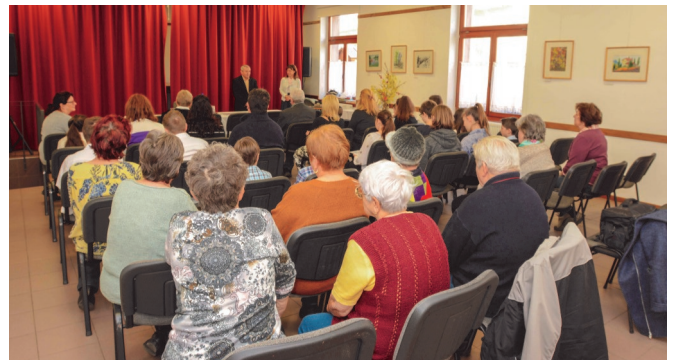
Felvételünk 2019.03.21-én készült az V. Szépolvasási versenyen.

Amint lehetőség lesz rá, a hagyományt folytatjuk.