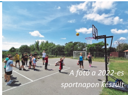
A fotó a 2022-es sportnapon készült

Május 20-án a Kővágószőlősi Sport Egyesület és Csipkebogyó Egyesület ismét SPORTNAPOT tart. Helyszíne a Buzás Andor Művelődési Ház, udvar és a sportpálya lesz.